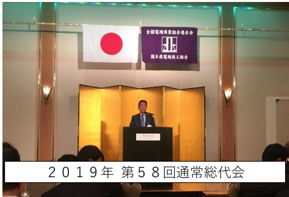
2019年 第58回通常総代会