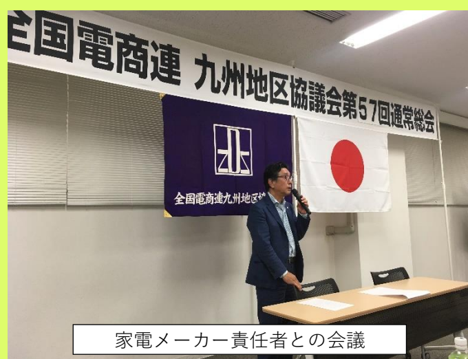
家電メーカー責任者との会議