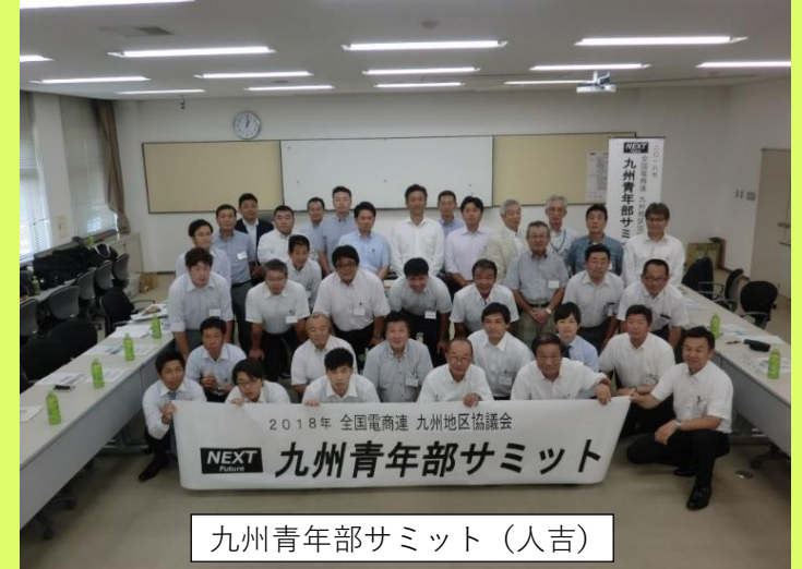
九州青年部サミット（人吉）