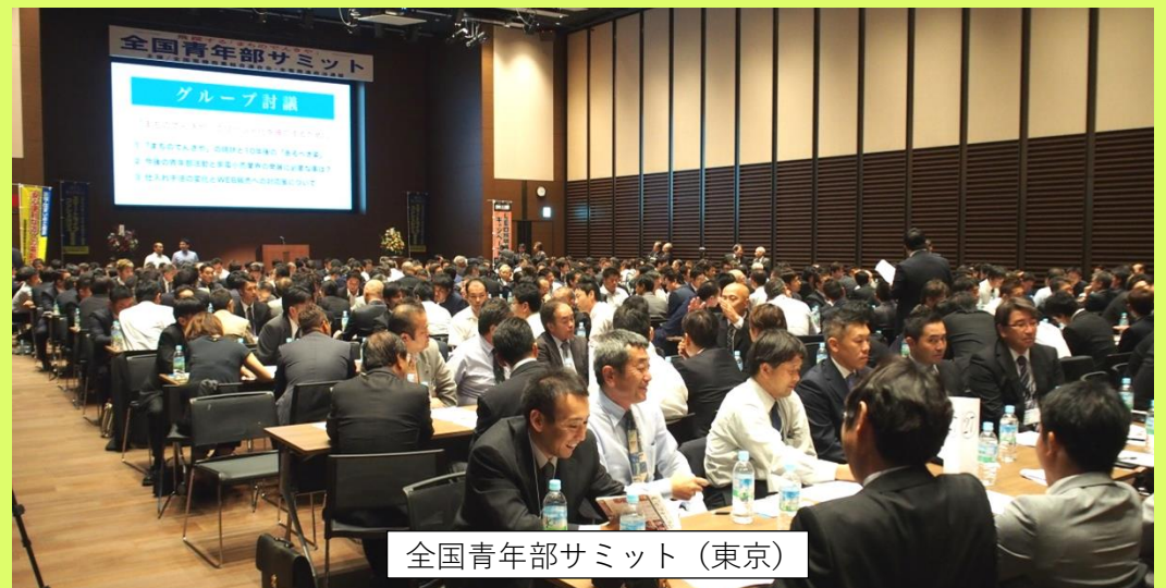
全国青年部サミット（東京）

「街の電気屋」高齢者無料安全点検訪問活動を定期的に行っています。これは、社会貢献の一環でもあり、まちのでんきやの存在感向上にも積極的に取り組んでいます。